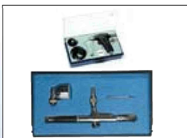
Stříkací pistole - fixírka