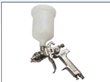
Stříkací pistole s nádobkou