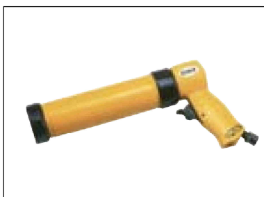
Pistole pro tuby - (kartuše)