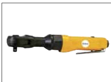
Ráčnový utahovák 1/2"