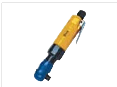
Ráčnový utahovák 1/4"