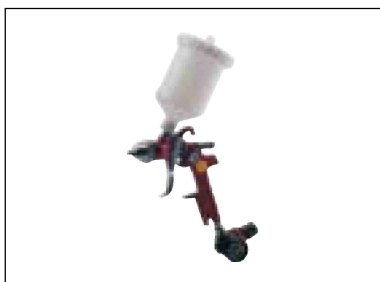
H.V.L.P. Stříkací pistole s nádobkou