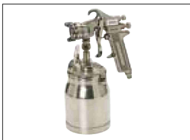
Stříkací pistole s nádobkou