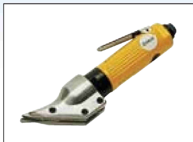
Nůžky na plech