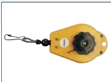
Balancér s ocelovým lankem