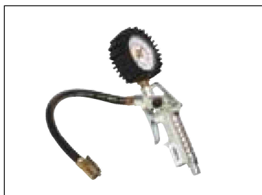
Plnicí pistole na huštění pneumatik