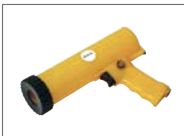
Pistole pro tuby - (kartuše)