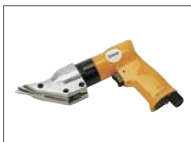
Nůžky na plech