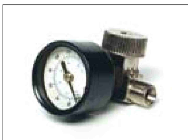
Regulátor s manometrem