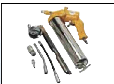
Tlaková maznice - sada