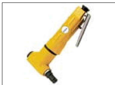
Prostřihávací nůžky na plech