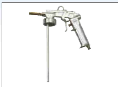
Pistole na stříkání dutin