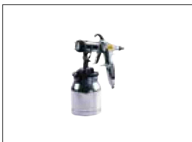
Stříkací pistole s nádobkou