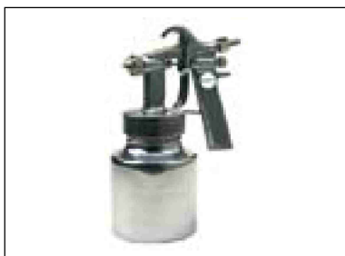
Stříkací pistole s nádobkou