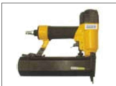
Sponkovačka kombinovaná s hřebíkovačkou