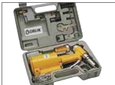
Nýťovací kleště - sada